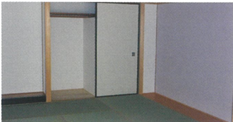
▲タンス置場と床の間がついた和室です。

居室と寝室を分けて使い、広いスペースが確保出来る1LDKタイプ。壺番館の中でも反響の多い居室で、景観が良く、使い勝手が良いとご好評頂いています。